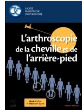
« L'ARTHROSCOPIE DE LA CHEVILLE ET DE L'ARRIÈRE PIED » (Société Française d'Arthroscopie) Éditions ELSEVIER MASSON, 2019