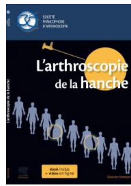
« L'ARTHROSCOPIE HANCHE » (Société Française d'Arthroscopie) Éditions ELSEVIER MASSON, 2020